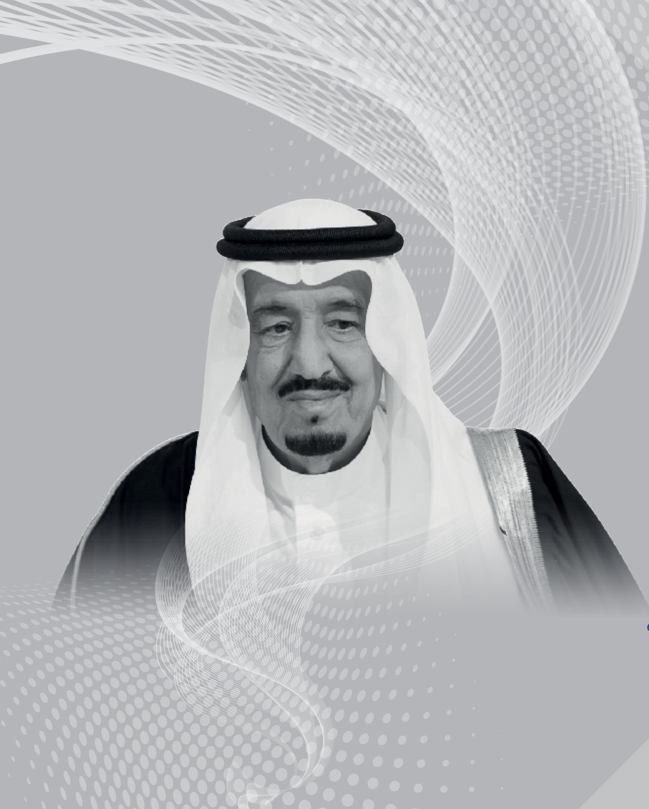
خادم الحرمين الشريفين الملك سلمان بن عبدالعزيز آل سعود «حفظه الله» ملك المملكة العربية السعودية